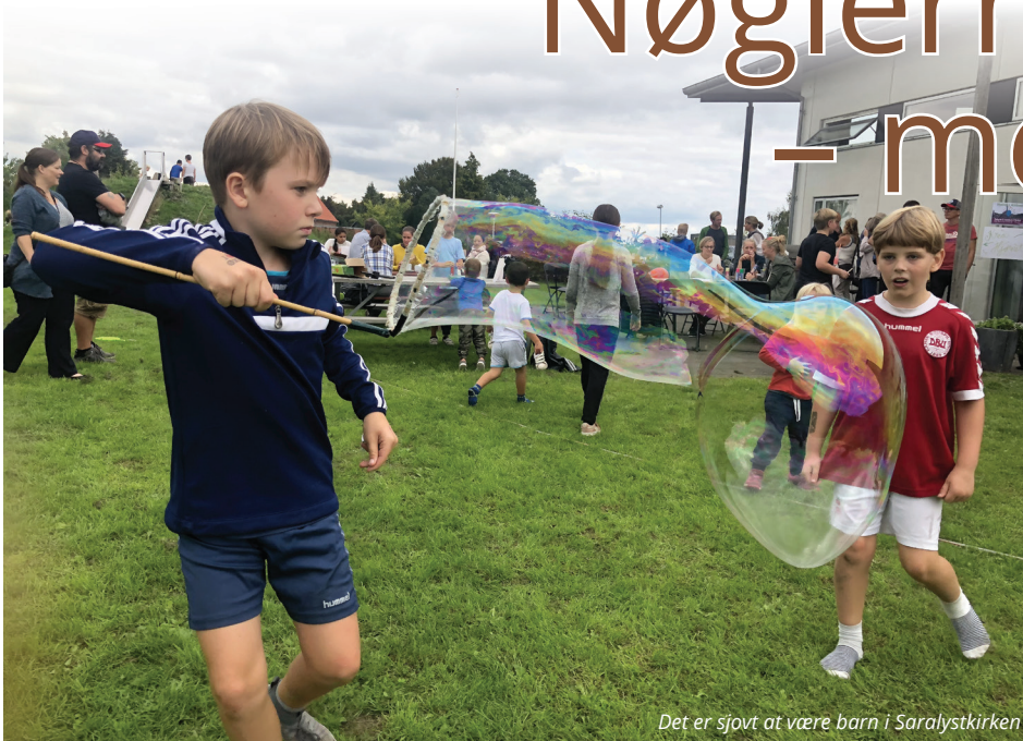
Det er sjovt at være barn i Saralystkirken

Vi kender nok alle til det ikke at kunne finde nøglerne. Sådan kan det i høj grad også være, når vi ønsker, at være en missional kirke