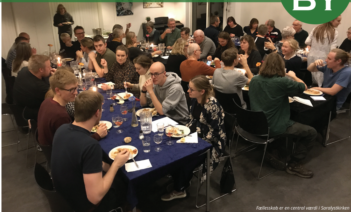
Fællesskab er en central værdi i Saralystkirken

at invitere til frokost, en gåtur, ringe til en anden, eller når et par stykker mødes og taler om nogle kapitler, de har læst i Bibelen.